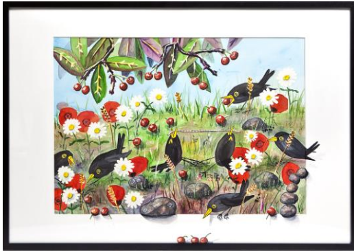
Nr 1 "Under körsbärsträdet"