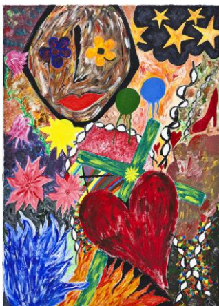
Nr 5 "Passion"