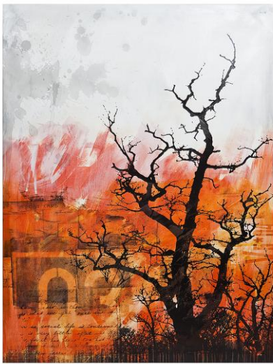
Nr 3 "Trädet"