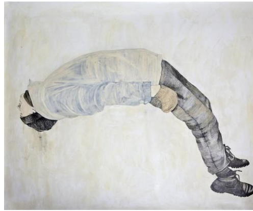
Nr 2 "Fallet"